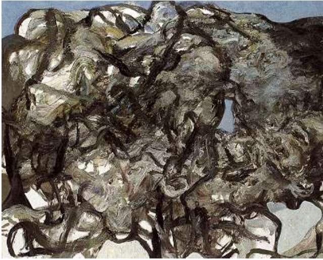
Sam Dillemans, 'Vrijers', 1999, olie op doek, 300 x 200 cm.

kan zijn voor de hele opzet. God en de duivel verschuilen zich in het detail.