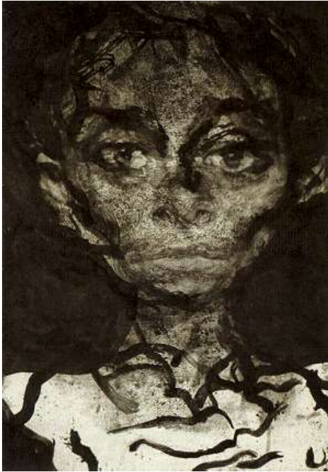
Sam Dillemans, 'Lizy', 1998, ets en houtskool op papier, 100 x 70 cm.

de onuitputtelijke weelde van de werkelijkheid. De waarachtige schilder beseft evenwel dat een natuurgetrouwe gelijkenis niet voldoende is en de expressiviteit van zijn figuren en zijn handschrift zal dan ook getuigen van zijn diepe bewogenheid. Een groot aantal belangrijke en boeiende schilders, werkzaam tussen 1850 en 1950, voldoet schitterend aan deze nog steeds populaire verwachtingen. Toch is de vraag of een kunstenaar al dan niet met succes aansluit bij de heersende mode niet van fundamenteel belang voor de waarde van zijn werk.