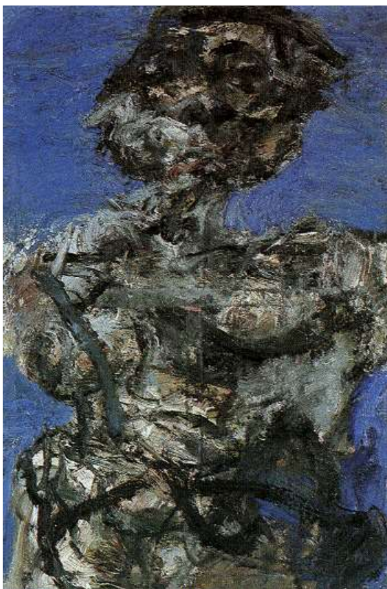
Sam Dillemans, 'Lizy', 1998, olie op doek, 150 x 100 cm.

Dillemans geen uitzonderlijk inventief of fantasierijk kunstenaar noemen. Wie zich in de eerste plaats met picturale problemen wil bezighouden zou misschien ook voor abstracte of non-figuratieve motieven kunnen opteren. Maar mensen gaan nu eenmaal in voorstellingen speuren naar afbeeldingen van dingen die werkelijk bestaan. Intuïtief zijn we geneigd om a.h.w. iedere onregelmatigheid of verstoring van een ongerept oppervlak te interpreteren als een betekenisvol spoor, een merkteken dat al gauw een figuur wordt die zich aftekent op een achtergrond. Vaak gaan we onverschillig voorbij aan abstracte, non-figuratieve of decoratieve tekens en figuren. Meer dan voor welke informatie ook zijn we gewoonlijk bijzonder gevoelig voor dingen die ons aankijken, gezichten van soortgenoten, portretten. Misschien is het dus wel een bijzonder goed idee om aan de hand van vertrouwde onderwerpen aandacht te vragen voor fundamentele schilderkunstige problemen.