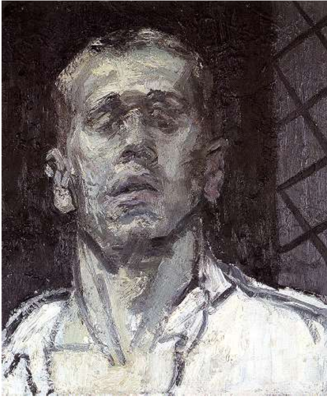
Sam Dillemans, 'Zelfportret', 1992, olie op doek, 60 x 60 cm.