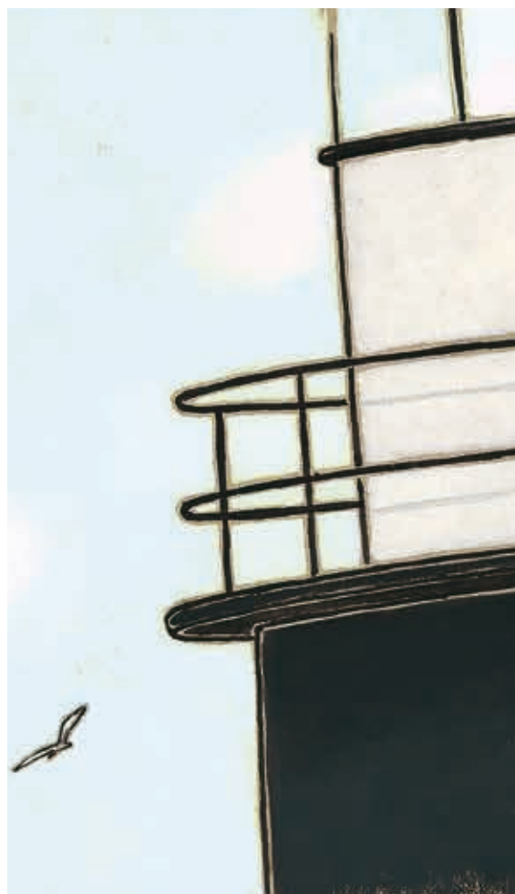
Wachten op Matroos , 2000.

Ook voor dit boek koos Godon recyclagekarton als ondergrond. Ze werkte haar beelden uit met pastel en olieverf en omljnde ze met penseel en inkt, waarbij ze de bruin-tint van het karton rondom uitspaarde. De beweeglijke lijnvoering maakt de figuren in Wachten op Matroos buitengewoon expressief. Alles in hun lichaamshouding drukt emotie uit. Om te beginnen bij Tijs, de vuurtorenwachter, die op een weezien met zijn vriend Matroos hoopt en met zijn blik gericht op de horizon de hele dag over het water tuurt vanaf zijn vuurtoren: een baken dat op zichzelf al symbool staat voor verlangen, een verlangen naar huis, of juist omgekeerd,