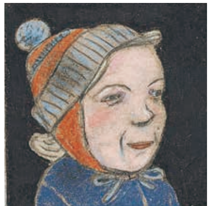
Ik wou , 2011.