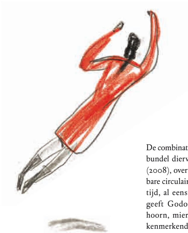
Ik denk , 2014.

De combinatie Tellegen-Godon was met de bundel dierverhalen Morgen was het feest (2008), over de seizoenen en onontkoombare circulaire en lineaire beweging van de tijd, al eens succesvol gebleken. Daarin geeft Godon Tellegens beroemde eekhoorn, mier en olifant op de voor haar kenmerkende wijze – een sprekende mimiek en lichaamstaal – een heel eigen identiteit mee. Groot is bijvoorbeeld de zeggingskracht van Godons bibberende eekhoorn die, zichtbaar gemaakt met enkele speelse lijnen, zodanig door de winterkou bevangen raakt dat hij, zoals alleen Tellegen dat kan verzinnen, in een hongerende “ijshoorn” verandert.