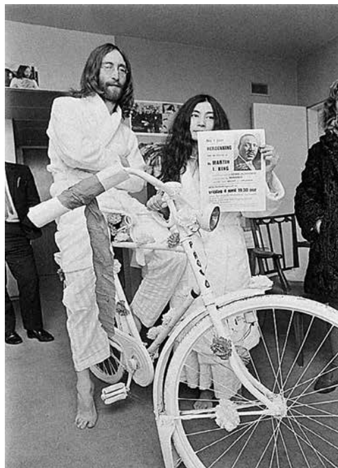
John Lennon op een witte fiets die hem door Provo is aangeboden en Yoko Ono met een affiche van een Martin Luther King-herdenking, Amsterdam, 1969