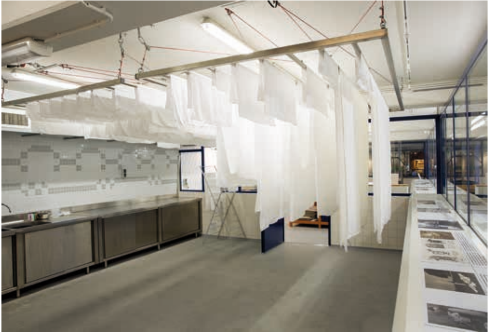
In de DamastWasserij wordt tafelgoed voor derden nog op een authentieke wijze gewassen en opgemaakt,

© Tommy de Lange in opdracht van TextielMuseum Tilburg