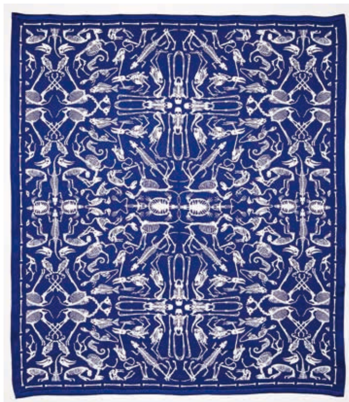
Perished, blauwe plaid, ontworpen door Studio Job met 50% trevira cs en 50% merinowol in het TextielLab, © Josefina Eikenaar / TextielMuseum

Horsting en Rolf Snoeren (Viktor&Rolf), Hella Jongerius, Studio Job en vele anderen. Het TextielLab is dan ook een plaats voor experiment. Het succes van het lab is het resultaat van een jarenlange investering in apparatuur en het opbouwen van expertise. Het museum wil daar ook in de toekomst verder op inzetten. Als bezoeker loop je vrij tussen al die bijzondere machines en op de meeste dagen zie je er experts aan het werk.