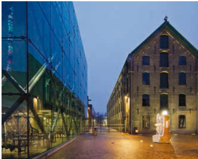
Entreegebouw en hoogbouw TextielMuseum,