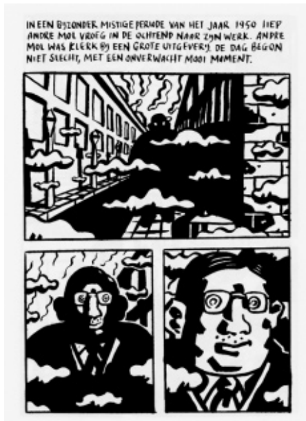
Pagina 1 uit De grote man (2000) van Milan Hulsing.