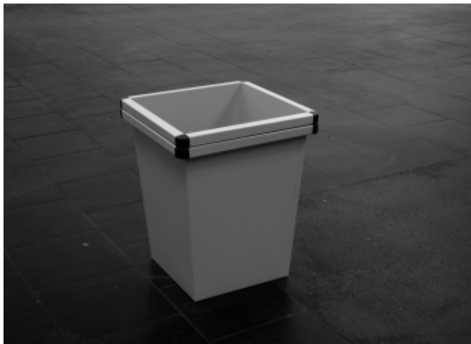
gerlach en koop, no two things can be the same , weggegooide prullenbak, 2012, 34 x 34 x 38,5 cm, Foto Kristien Daem.

Ook herhalingen zijn belangrijk. Door iets te herhalen, wil gerlach en koop de aandacht vestigen op wat net niet of net wel zichtbaar wordt. Ze gaan op zoek naar het verschil tussen wat gelijk is. Dat verschil kan piepklein zijn, maar het is er wel en het