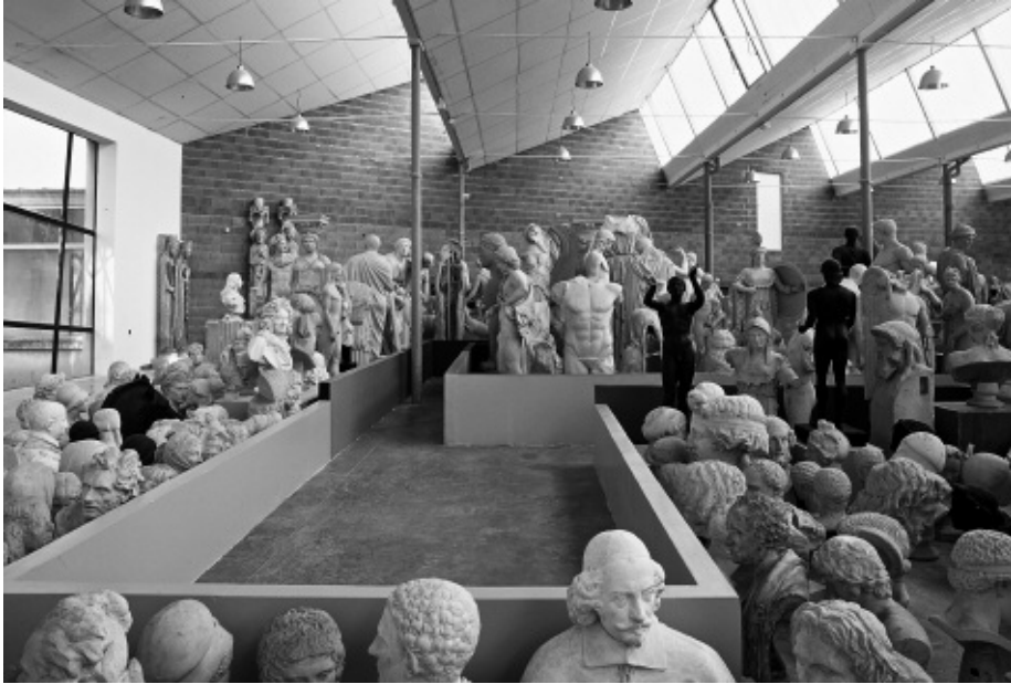
Musée des Moulages in Lyon, Frankrijk, 2003 © Krijn de Koning.

bovenzijde geplaatste dito dwarsbalk. Als eilanden in de ruimte nodigen ze uit tot “voetje van de vloer”. Nieuwe kenmerken: volumineus, geometrisch en vooral: ruimte-dominant. In het jaar dat volgt, ijkt hij zijn vormentaal. Eerst nog met beelden die zijn opgebouwd uit gerecycleerd materiaal als formica deurtjes of verschillend gekleurde platen hardboard, om via monochrome vlakken (soms is de houtstructuur nog zichtbaar, zoals bij een werk uit sloophout dat onwillekeurig gedachten aan de meubelontwerper Piet Hein Eek oproept, die omstreeks die tijd furore begon te maken met zijn eerste sloophouten kasten) uit te komen op een kubus die als één van de allereerste objecten kan worden beschouwd in de definitieve huisstijl. Dan zitten we nog maar bij “opus 19”, een atelierwerk uit 1990 dat hij toont in Amsterdam (Picaron Editions). Het object, dat met zijn formaat van 1,60 m x 2 x 2,3 m net te klein is om in rond te dwalen, heeft diverse inkepingen en doorkijkjes en is opgetrokken uit plaatmateriaal dat is geschilderd in drie contrasterende kleuren. De huid van het beeld is volledig glad en het geheel oogt industrieel. Geplaatst op een vloer met grote mozaïekelementen is het een haast grafische ontkenning van de architecturale ruimte.