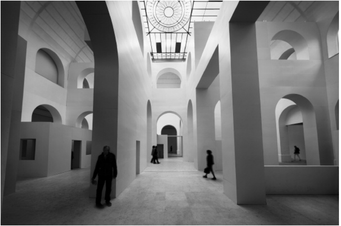
Vides pour un patio in het Musée des Beaux-Arts in Nantes, Frankrijk, 2011 © Krijn de Koning.

Ronduit gedurfd is zijn gigantische dwarsdoorsnede van de Nieuwe Kerk in Amsterdam. Overhoeks georiënteerd op de plattegrond van de kerk liet de tijdelijke Kerkmeester op vijf meter hoogte een vloer aanleggen in een ruitvorm met een oppervlakte van een royale 800 vierkante meter. De nieuwe Nieuwe-Kerkvloer had een meervoudige gelaagdheid. Het totaalzicht op het binnenste van de kerk werd bepaald geweld aangedaan. Ook de foielelijke stellages onder de vloer zullen niet hebben geleid tot veel bewondering – al zal De Koning zelf meer oog hebben gehad dan gemiddeld voor het patroon van de stutten. Eenmaal op de vloer beland, kon men de kerk aanschouwen zoals ooit de bouwers, restauratoren en, vooruit, wellicht enkele technici hadden gedaan. Maar nooit zo. Wandelend op de hoogte van de glas-in-loodramen waren die niet alleen van veel dichterbij te bestuderen, tevens liep je direct óp/over het invallende licht. De zeventiende-eeuwse preekstoel was nu eens niet vanuit een onderdanige positie te benaderen, de kerkganger kon oog in oog staan met zijn Amsterdamse voorvaderen, gebeeldhouwd op het dak van de kansel, dat vooral als klankbord