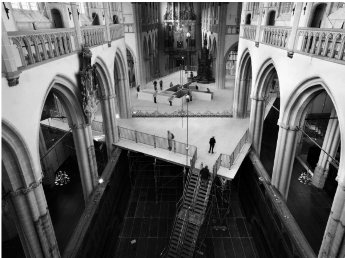
Nieuwe Kerk in Amsterdam, 2010 © Krijn de Koning.

dienstdoet. De vloer zelf liet hij deze keer in de eigen kleur van het hout, maar in het hart was een aantal verdiepte kamertjes in diverse kleuren uitgespaard. Uiteraard weer met diverse uitsparingen. Betrad de bezoeker het staketsel van de zijkant, bovengekomen kon hij/zij afd(w)alen tot in de kern. Uit het licht het schemerduister in, te biecht gaan of de kans grijpen tot zelfcontemplatie. En voor de kinderen (onder ons): ook gewoon spelenderwijs een trappenhuis verkennen!