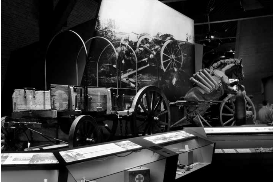
Zaalzicht van het vernieuwde museum © In Flanders Fields Museum.

een Vlaamse vluchteling die zijn verhaal doet; vier soldaten uit vier legers die over de kerstbestanden vertellen; een onderpastoor uit Dikkebus, gevlucht naar Reningelst, die het leven net achter het front in al zijn chaos en morele verwarring opvoert; Fritz Haber, de chemicus die gas als oorlogswapen perfectioneerde en klinisch komt bewijzen wat hij heeft bedacht en uitgevoerd. Maar het zijn vooral de getuigenissen van een dokter en twee verpleegsters die het sterkst blijven hangen. Dat was al het geval bij de eerste museumopstelling. Het was dan ook de enige plek waar een kwetterende horde vijftienjarige Engelse schoolmeisjes echt onder de indruk van was. Luisterden ze naar de speciaal voor het museum gecomponeerde soundtrack (door Stuart Staples van de Britse muziekgroep Tindersticks) die je gedurende het hele bezoek hoort (en niet hoort)?