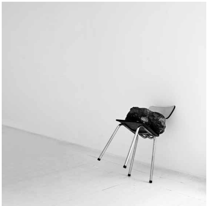
Boven: An Exciting New Relationship Is Coming Soon , video-installatie, 2000. Onder: Fasten Your Seatbelt , installatie, 2009.