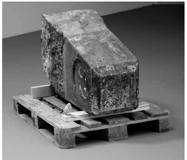
Boven: Liter , installatie, 2008.