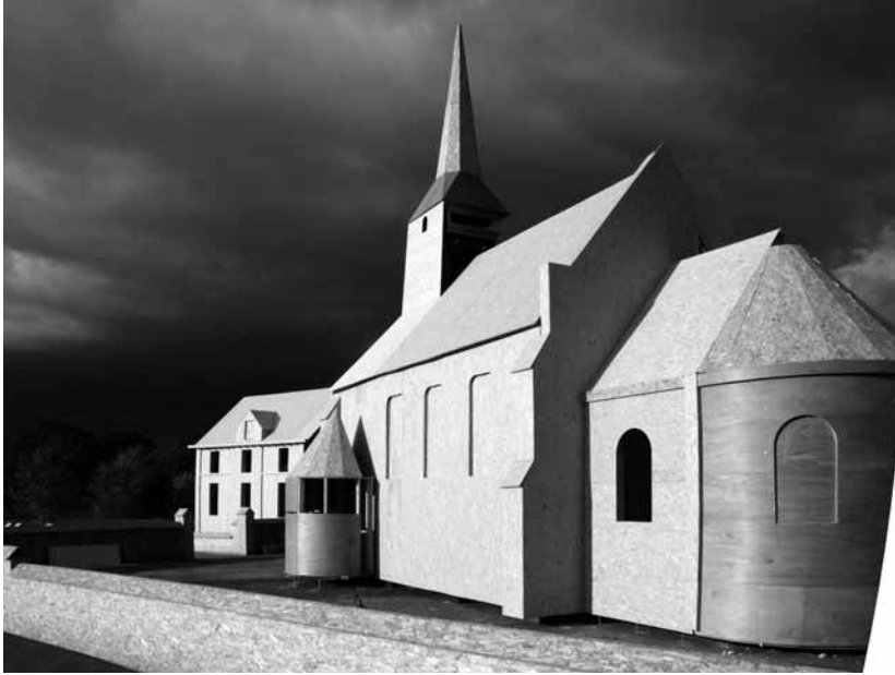
Maquette van Het dorp , 2011.