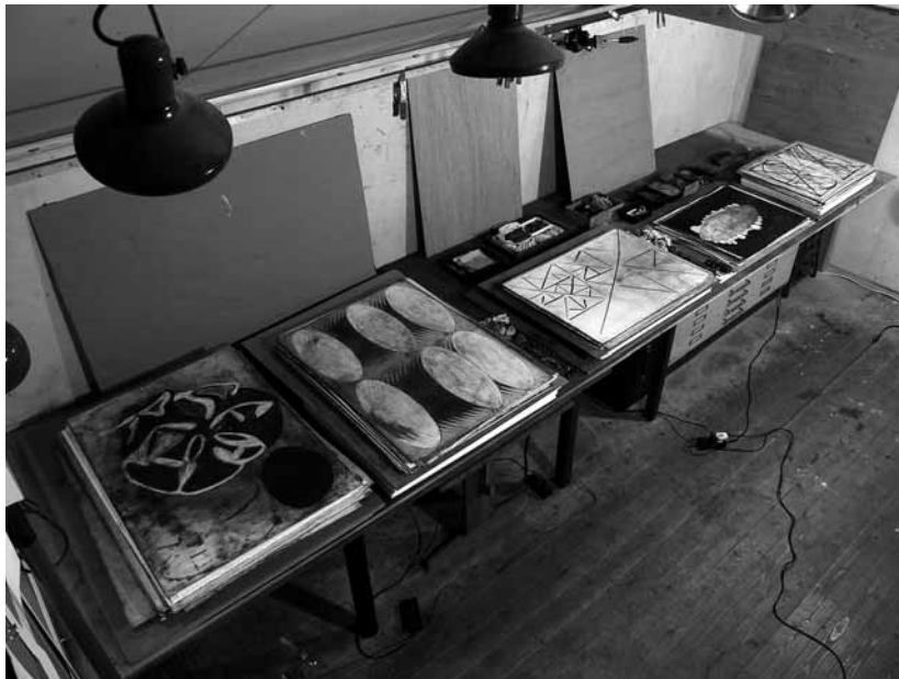
Het atelier van Allie van Altena.

Zo brengt hij de versneden vormen in collages op een betekend blad dat zich in de achtergrond voordoet als een verweerde muur. Tot die versneden vormen horen sinds het studiejaar in Londen ook vierletterwoorden als HOPE en FEAR. Voorts voegt hij er terzijde een figuur van bijvoorbeeld een ovaal in kleur aan toe. De tekening krijgt gaandeweg een zelfstandige vorm. Hij werkt op grote formaten: 56 x 76 cm. en 122 x 152 cm..