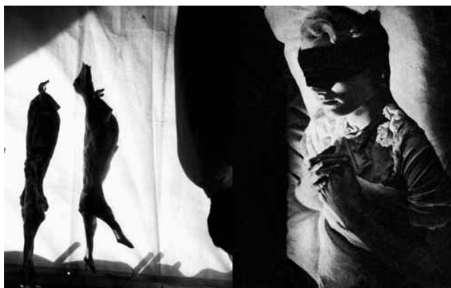
Paul Bogaers, Upset down , Foto Paul Bogaers.

varkenskarkassen leidt dat tot de bizarre illusie dat de dieren op hun tenen staan en in een sierlijke dans verwickeld zijn. Dit principe van de omkering is in het boek zo consequent doorgevoerd dat de lezer het van twee kanten kan openen en doorbladeren.