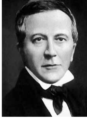
G. Groen van Prinsterer

zoals dat al eens is vastgesteld door John Stuart Mill: “Hoe goed zou het voor Engeland niet zijn als de Conservatieven consequent zouden stemmen voor alles wat conservatief is en Liberalen voor alles wat liberaal is. [...] De conservatieven – alleen al gezien hun bestaansgrond de stompzinnigste partij – hebben zich in dit opzicht voor verreweg de grootste zonden te verantwoorden...” 5