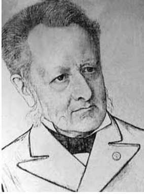
J. Heemskerk, Foto Nationaal Archief Nederland.