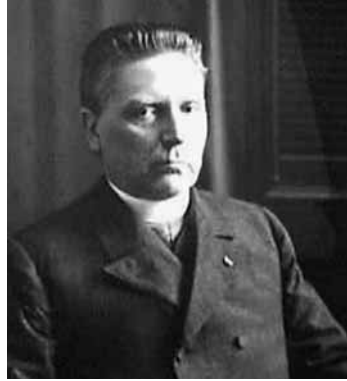
W.H. Nolens, Foto Nationaal Archief Nederland.

zuiling was te sterk, geschikte politici om vorm te geven aan het conservatisme ontbraken: een man als Treub bijvoorbeeld, die in de jaren twintig een dergelijke betekenis had kunnen krijgen, was te veel verbonden met expliciete ondernemersbelangen, maar ook veel te ongedurig om iets tot stand te brengen. In de jaren dertig kwam het conservatisme niet op aangezien de slagschaduw van de antirevolutionaire politicus Colijn zo diep was, dat aan de rechterzijde van het politieke spectrum niets meer wilde groeien. Conservatieve opvattingen waren verdeeld over de bestaande – vooral de confessionele en een deel van de liberale – politieke partijen en dat bleef zo. Nederland werd een zeer traditionalistisch land, maar bood geen ruimte aan een conservatieve ideologie.