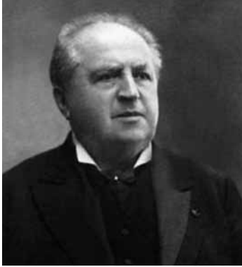
Abraham Kuyper.