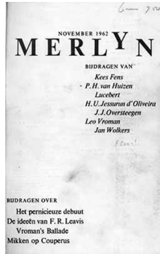
Eerste nummer van het tijdschrift Merlyn , november 1962.

In de laatste jaren worden deze wat primitieve stereotypen van verschillende kanten weer gecorrigeerd, ook aan de hand van herlezing van de bijdragen die in Merlyn zelf hebben gestaan. Ook is het zichtbaar gemaakt dat het blad niet uit de lucht kwam vallen, maar geworteld was in bewegingen, vooral uit het buitenland, die in de Nederlandse kritiek, en in mindere mate aan Nederlandse universiteiten nog niet waren