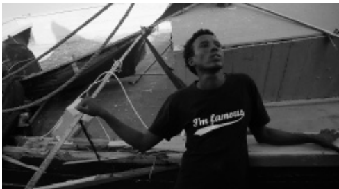
Still uit Those Who Feel the Fire Burning , een film van Morgan Knibbe, Nederland, 2014, 74 minuten.

Knibbe maakte vervolgens zijn eindexamenfilm A Twist in the Fabric of Space (2012, 20 minuten) in eigen land, maar wel al met veel van de elementen die ook in Those Who Feel the Fire Burning een rol spelen. Het was een filmisch essay in vier hoofdstukken, die een levenscyclus beschrijft aan de hand van zeer uiteenlopende stijlfiguren: van een technostadssymfonie tot een verstilde oerknal. In feite vormde de film een aanklacht tegen een gebrek aan waardevol contact tussen mensen in een tijd van overcommunicatie. Knibbe speelde ook daarin met de manipulatieve en hypnotiserende kracht van film. Hij wilde "een tripachtige ervaring en visuele muziek maken met documentair beeldmateriaal. Het echte leven en de virtuele wereld moesten door elkaar heen gaan lopen. Qua vorm en stijl wilde ik dat het soms haast zou lijken op een videoclip of een reclame." Het was de meest gedurfde exercitie van