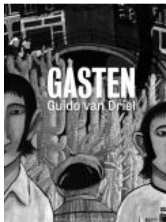
De kaften van Om mekaar in Dokkum (2004), De ondergang van Amsterdam (2007) en Gasten (2012) © Guido van Driel / Oog & Blik.

als filmmaker met de documentaire U spreekt met Frank Laufer , over de excentrieke Nederlandse fotograaf. Vanaf 2000 combineert Van Driel strips en films, aangevuld met occasioneel schilder- en illustratiewerk.