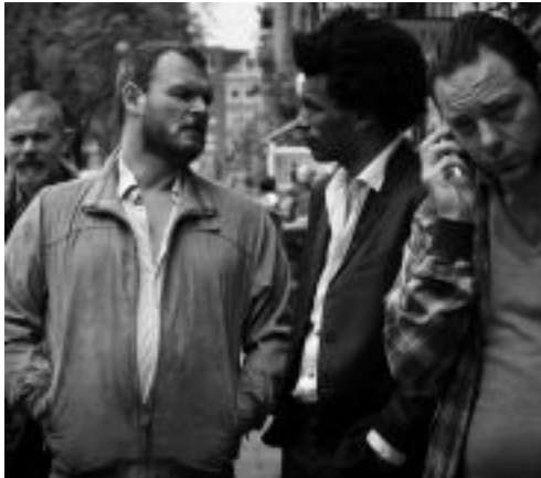
Still uit De wederopstanding van een klootzak (2013), de verfilming van de strip Om mekaar in Dokkum .