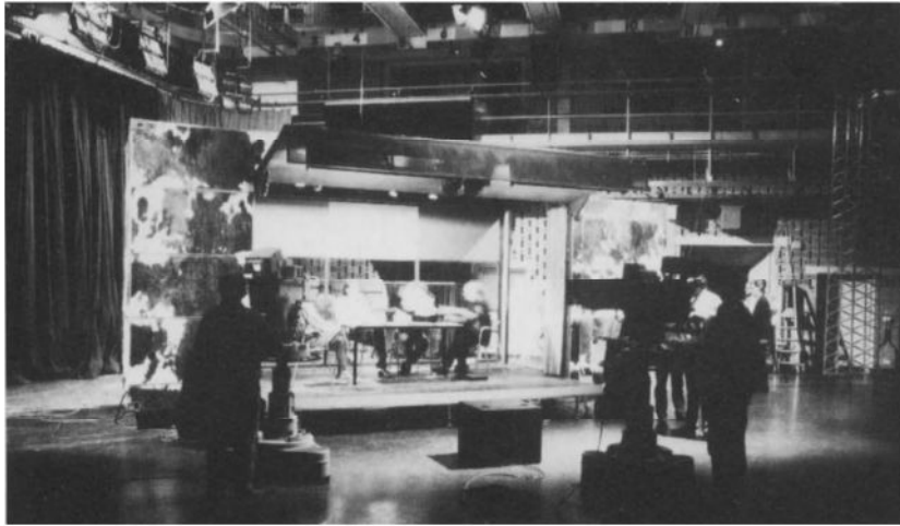
Stéphane Beel, studio BRTN „Container“.