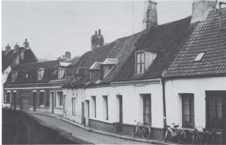
Maisons basses et sans étage du Saint-Omer d'aujourd'hui, quai des Salines.

daient pas. Dans la pratique, ceci se traduit par une modification dans la rédaction du «Régistre contenant les actes plus spécialement affectés aux Réfugiés Hollandais»: à partir de 1791, les professions et la religion pratiquée ne sont plus indiquées, tout ceci étant devenu superflu.