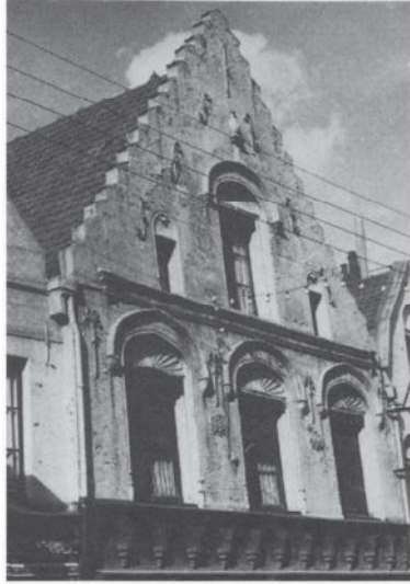
Maison de «Style espagnol» dans le Saint-Omer d'aujourd'hui, rue de Dunkerque.

«intra-muros»: dans la rue de la Poissonnerie, les maisons à étage et les maisons de plain-pied se côtoient. Toutes sont couvertes de tuiles ou d'ardoises. Dans le Haut-Pont, les dépendances (granges, hangars etc...) sont couvertes de chaume. Dans le Lyzel, où l'on trouve surtout de petites maisons, toutes les toitures sont en chaume. Ceci n'était pas sans présenter quelque danger en cas d'incendie. Ce danger servit de prétexte, en 1784, à une ordonnance de police interdisant de lancer des «ballons aérostatiques» parce qu'ils pouvaient allumer des feux en tombant «...sur des magasins à foin, sur des granges, sur des maisons couvertes de chaume...» (10)