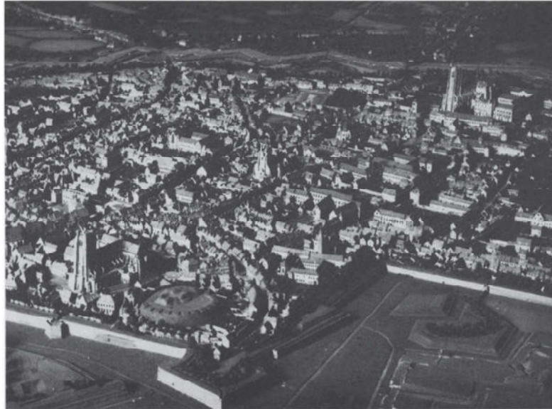
Saint-Omer. Vue générale du sud-ouest. Plan général de 1758. Palais des Invalides.

la querelle de Maître Vissery avec le Magistrat. (2) En 1780, un Audomarois, Montbailly, est accusé à tort d'avoir assassiné sa mère. Il est jugé, condamné à mort, exécuté... puis reconnu innocent. C'est à ce sujet que Voltaire, volant une fois de plus au secours de l'innocence, écrit La Méprise d'Arras . En 1782, éclate la seconde affaire. Un avocat de Saint-Omer, Maître Vissery, a l'idée d'installer un paratonnerre sur le toit de sa maison. Poussé par l'opinion publique, qui voyait quelque chose de maléfique en cette épée braquée vers le ciel, le Magistrat de Saint-Omer fait enlever l'appareil. Maître Vissery porte plainte. Un jeune avocat de 24 ans, Maximilien de Robespierre, est chargé de sa défense. Il obtient provisoirement gain de cause et Maître Vissery est autorisé à réinstaller «son» paratonnerre.