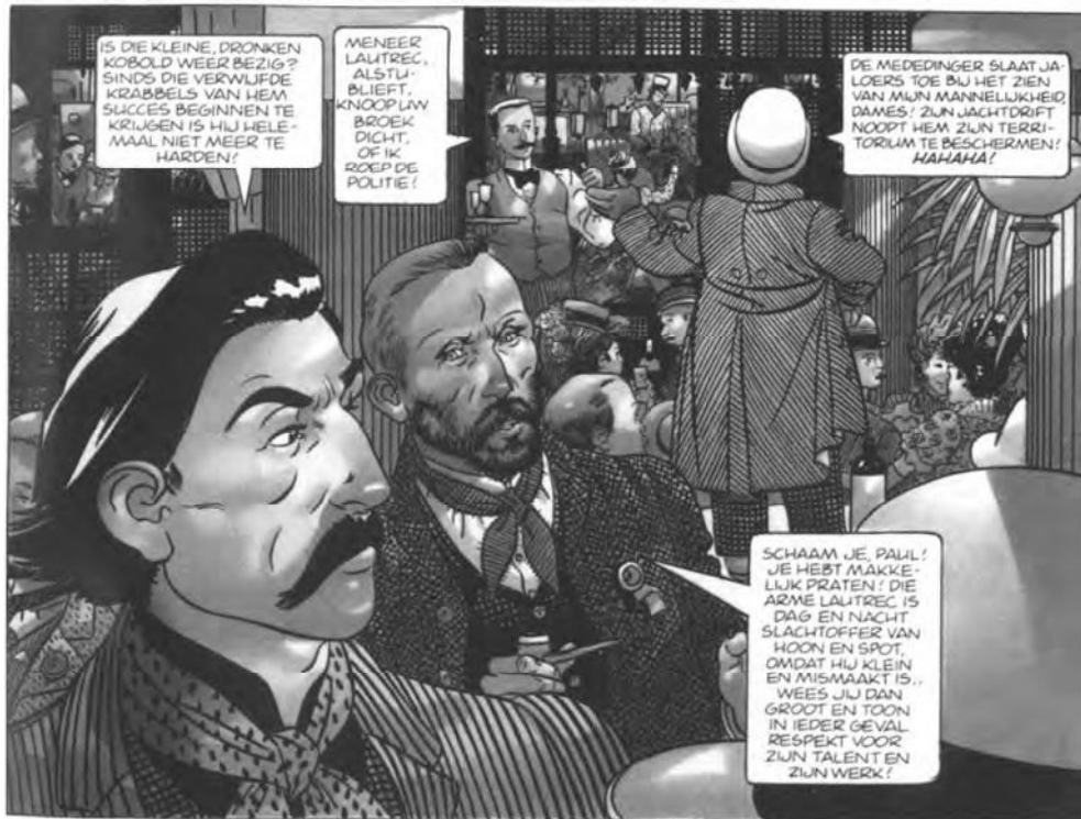
Uit Dick Matena's „Gauguin en Van Gogh”.

Hij gokt op een internationale carrière en vestigt zich in Spanje. Het avontuur duurt twee jaar. Om onduidelijke redenen keert Dick Matena terug naar het noorden, naar België, niet naar Nederland. Hij vestigt zich in de buurt van Turnhout. Daar woont hij nog altijd.