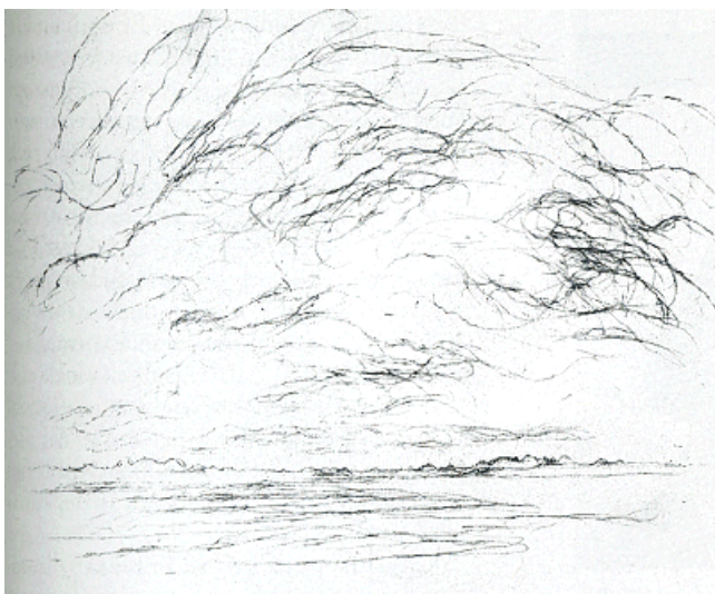
Willem den Ouden, 'De Waal', 1997, litho chine collé, 35 x 35 cm.

in het grensgebied figuratief en abstract een aangrijpend, mystiek aandoend natuurdagboek.