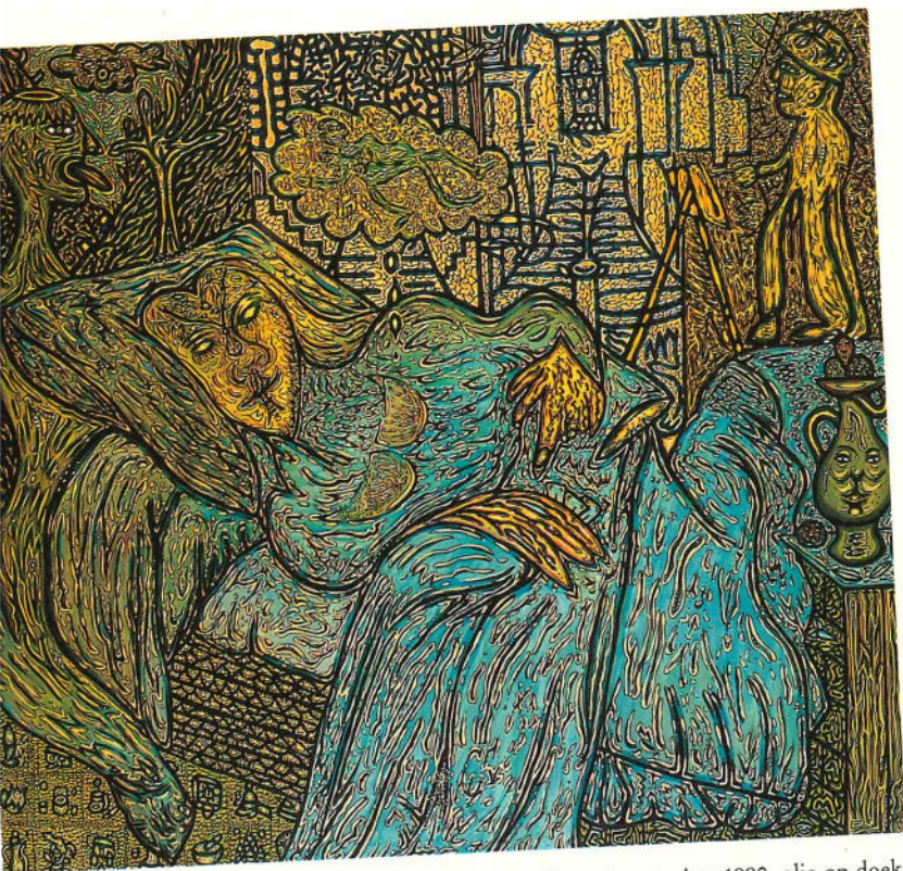
Pjeroo Roobjee, „Ivoren torens, innerlijke burchten”, februari-september 1990, olie op doek, 200 x 220 cm.

de personages spreken hen afleidt naar zijpaadjes en zo een boeiende ontwikkeling in de weg staat.