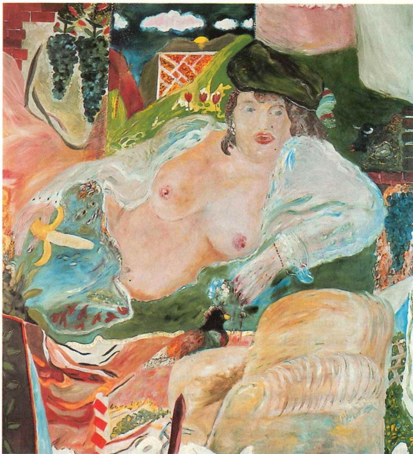
Pjeroo Roobjee, „Groot Hollands naakt - Rembrandt intiem”, 1968, olie op doek, 200 x 180 cm.

vergeefs aan te zetten om de artistieke ambities om te zetten in een regentaatsdiploma.