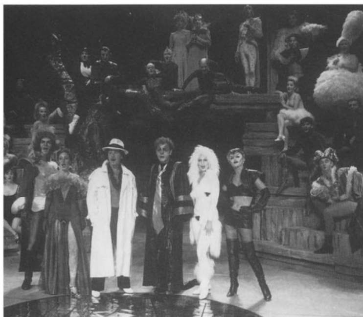
Het ensemble van „Dear Fox” (1990).

dies dekken niet eens de loonlasten en er is geen sprake van structurele sponsoring. Alleen op commerciële basis werken is een riskante onderneming als men bedenkt dat in The West End en Broadway de musicals vijf tot tien jaar lopen en mede door de jaarlijkse toestroom van toeristen de kans krijgen de onkosten te dekken en winst te maken. In Vlaanderen en Nederland is een