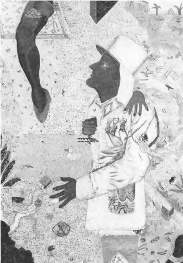
Mon légionnaire (180x122, 1973) door Pjeroo Roobjee.

stukje Marlène Dietrich, die fluistert in het duister: «Mon légionnaire» (1973).