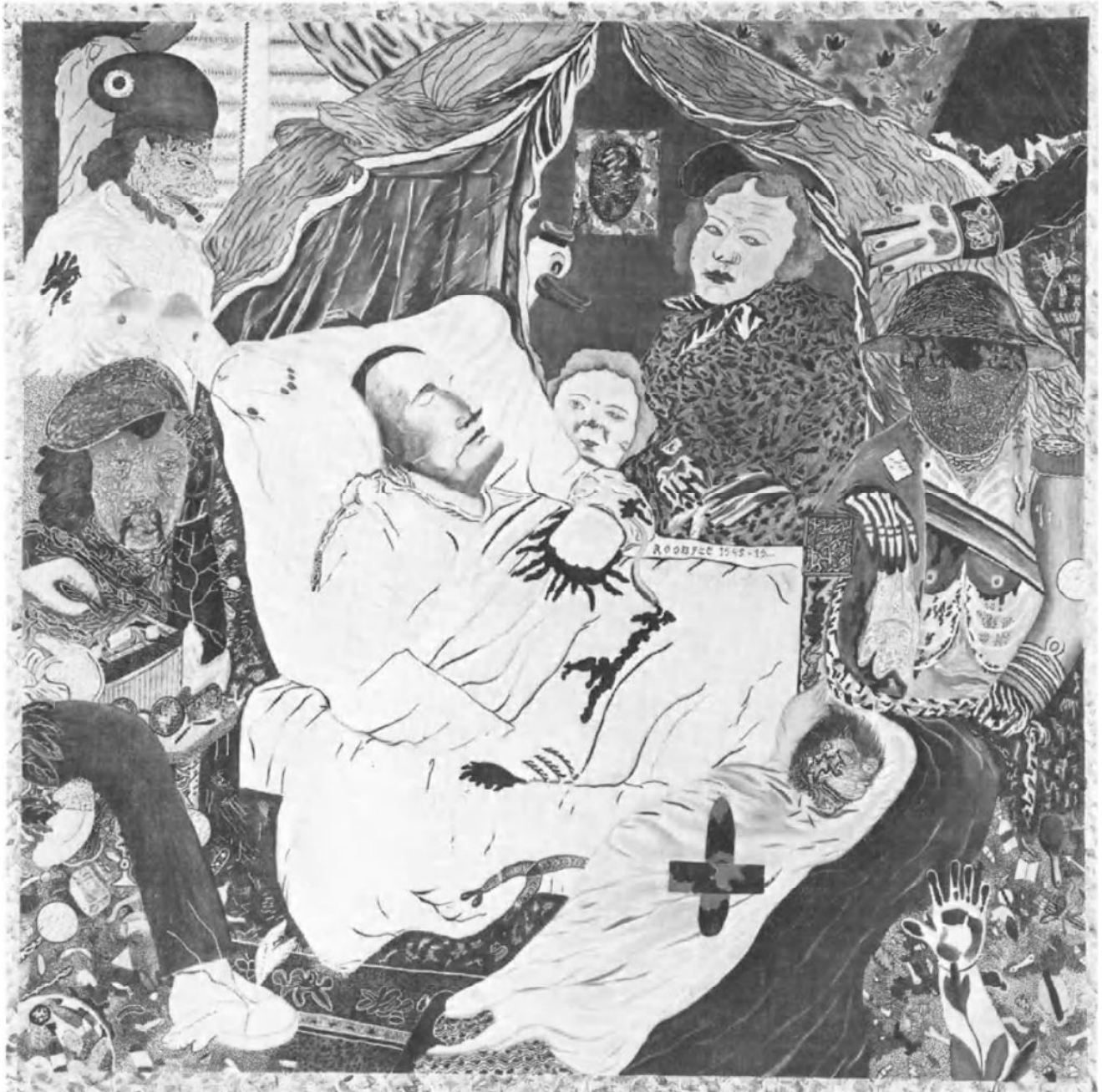
Ik veriang dat mijn asse ruste aan de oevers van de Poekebeek, te midden van de Poekenaars die ik zozeer heb liefgehad (1971) door Pjeroo Roobjee

is de schilderkunst van pjeroo roobjee zonder meer literatuur?