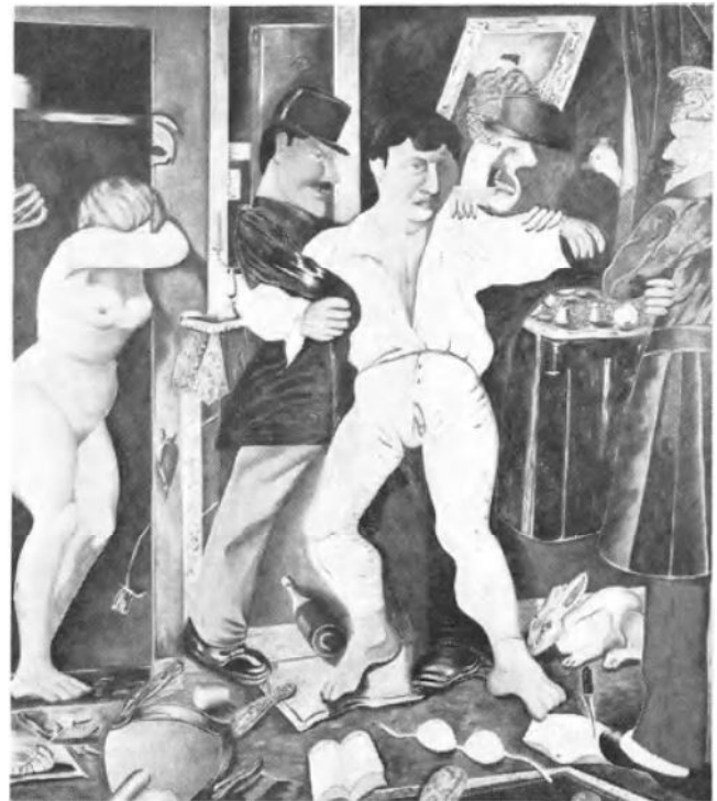
Het overspel (200x180, 1974-'75) door Pjeroo Roobjee.

De omgevallen stoel links vooraan, de rollende champagnefles en de rechterhoek van het werk vormen een driehoek die belangrijk is voor de ruimte-ervaring van het schilderij en de plaats van de personages. De stoel valt als het ware naar ons toe, uit het schilderij (moet gedeeltelijk buiten het schilderij gedacht worden). De hals van de fles verwijst naar het meest verwijderde punt en op dezelfde lijn staat een weerstand biedende voet van de „overspeler” naar voren geschoven en de vastberaden statische voet van hij die zal berechten. Met middenin een gevallen, natrillend mes in een vrouwenbroekje, d.w.z. een mannelijk element dat in de vrouwelijke weekheid van het linnen inslaat, maar tevens het verband legt met de vrouw die zich buiten de driehoek bevindt en dus op een andere manier aan het gebeuren deelneemt. Uit de houding van de drie personages, die door een omstrengeling en door de kleur gebonden zijn, ontwikkelt zich een enorme dynamiek die bepalend is in de zojuist beschreven ruimte. Aan de ene zijde van die dynamiek, de Vlaamse pin-up in Playboy-achtige kleuren geschilderd, en rechts meer vooraan in het schilderij, de kommissaris die zal berechten.