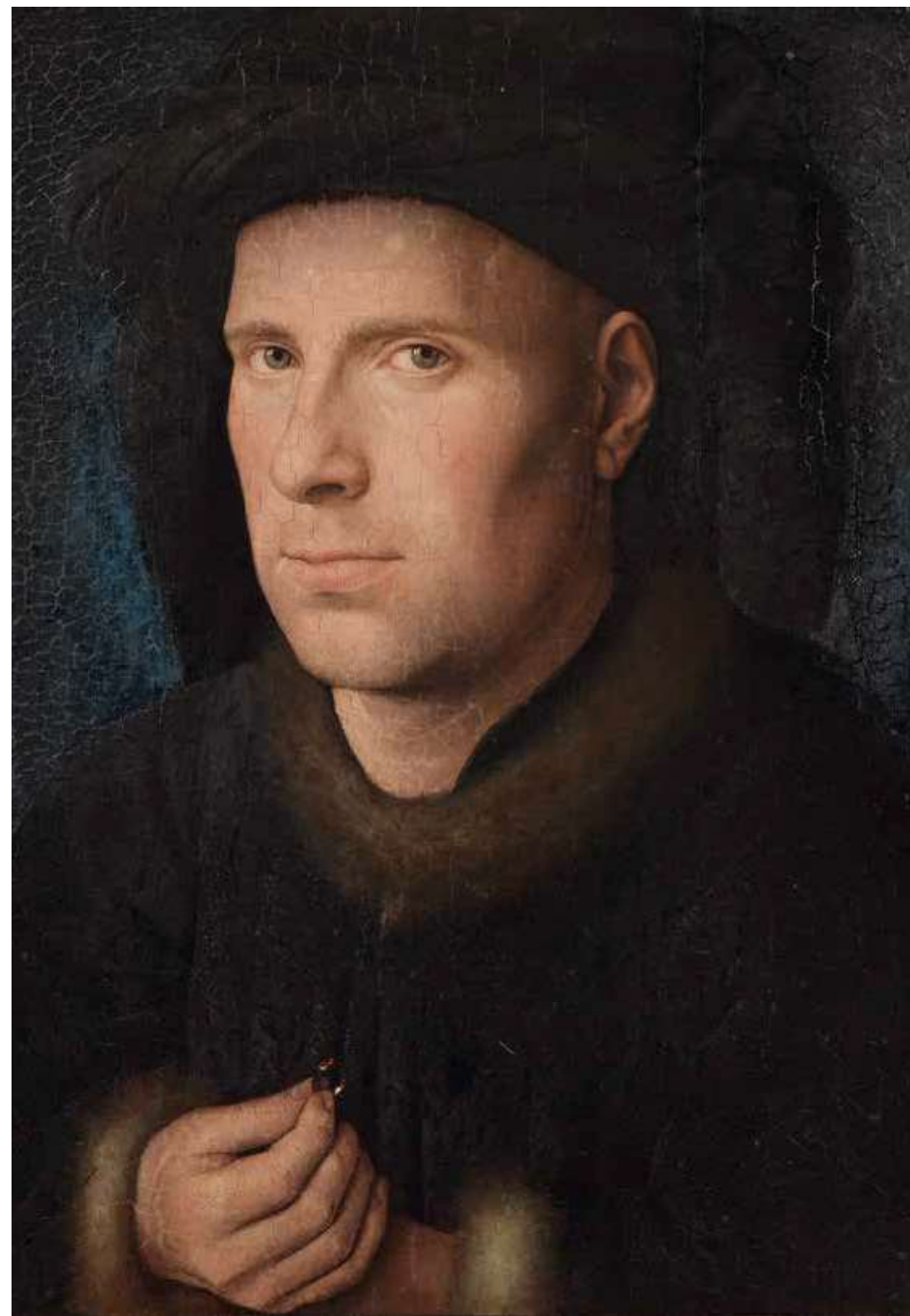
Jan van Eyck, Portret van Jan de Leeuw , 1436, olieverf op paneel, 33 x 27.5 cm, Kunsthistorisches Museum Wenen, Gemäldegalerie