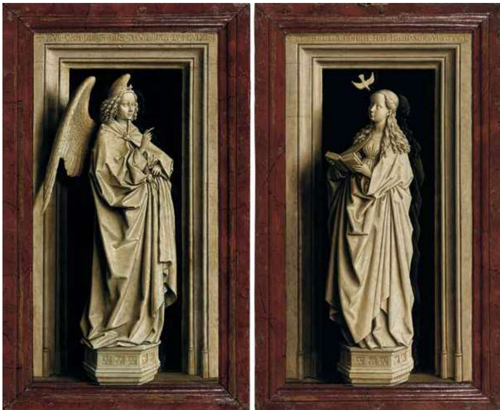
Jan van Eyck, Annunciatiediptiek: Aartsengel Gabriël (links), De Maagd (rechts), circa 1435, olieverf op paneel, linkerpaneel 38,8 x 23,3cm, rechterpaneel 39 x 24 cm, Museo Nacional Thyssen-Bornemisza, Madrid

Decennialang bleven Van Eycks bijzondere kleurenpracht, zijn uitzonderlijke detailweergave en uiterst tactiele stofweergave verborgen voor de toeschouwer.