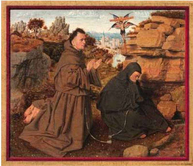
Jan van Eyck, Heilige Franciscus ontvangt de stigmata, 1440, olieverf op vellum op paneel, 12.7 x 14.6 cm, Philadelphia Museum of Art, John G. Johnson Collection, 1917

coherent. Ze is zo geniaal dat ze niet alleen te verklaren is door zijn uitzonderlijke talent voor de uiterst precieze waarneming van zijn omgeving. De tentoonstelling gaat uit van de hypothese dat Van Eyck zich niet alleen baseerde op praktische informatie, maar ook op theoretische kennis. De observatie en de registratie van complexe lichtverschijnselen als reflectie, absorptie of breking zonder constante belichting was hoegenaamd geen sinecure. Van Eyck had ook alleen natuurlijk licht of flikkerende kaarsen om zich heen.