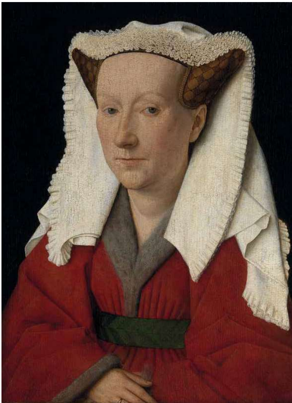
Jan van Eyck, Portret van Margareta van Eyck , 1439, olieverf op paneel, 32.6 x 25.8 cm, Musea Brugge – Groeningemuseum