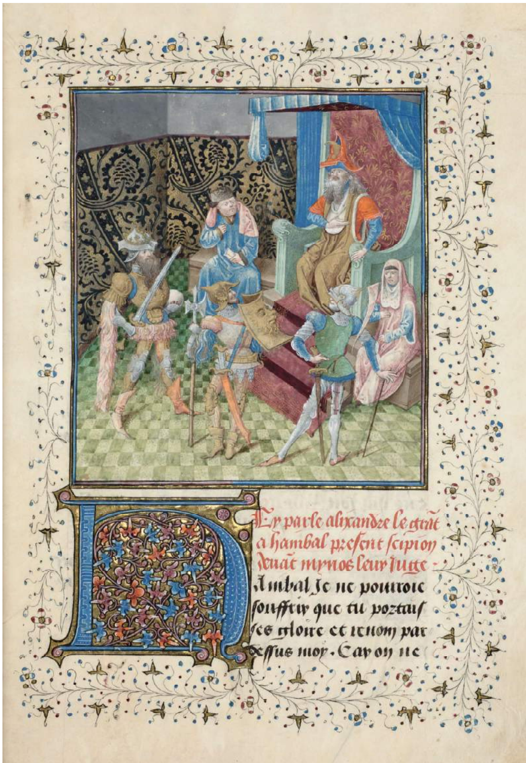
Alexander de Grote, Hannibal en Scipio Africanus verschijnen voor koning Minos om van hem te horen wie van hen de grootste generaal is. Miniatuur van Jan de Tavernier in Lucien de Samosate, Débat d'honneur