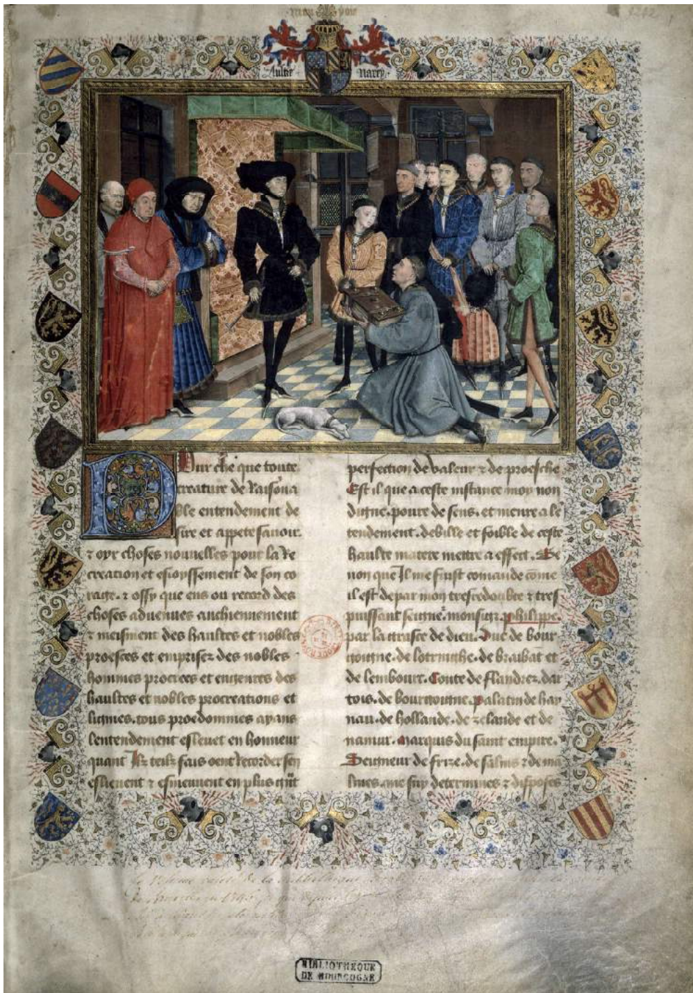
Jean Wauquelin biedt zijn werk aan Filips de Goede aan. Miniatuur van Rogier van de Weyden in Les Chroniques de Hainaut, Zuidelijke Nederlanden, 1447-1468