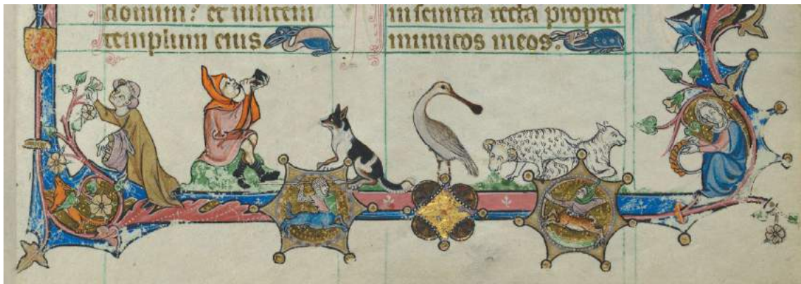
Randversiering in het Peterborough Psalter