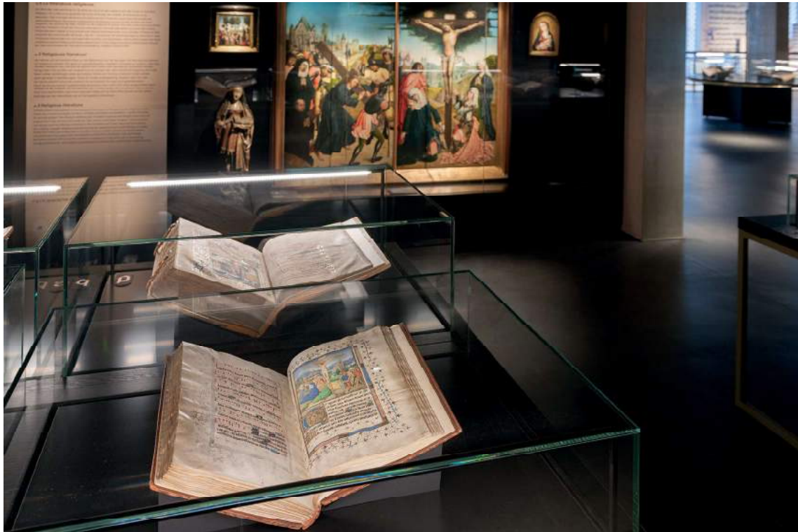
Zaalzicht van het KBR museum

elegante heerser, op enige afstand geflankeerd door zijn entourage. Het tafereel is een verhaal binnen het verhaal van het boek, want in deze miniatuur wordt Filips het boek zelf, de Chroniques de Hainaut , aangeboden. Een prachtig staaltje propaganda dat hem hielp zijn nicht Jacoba van Beieren deze regio afhandig te maken. De miniatuur wordt toegeschreven aan Rogier van der Weyden.